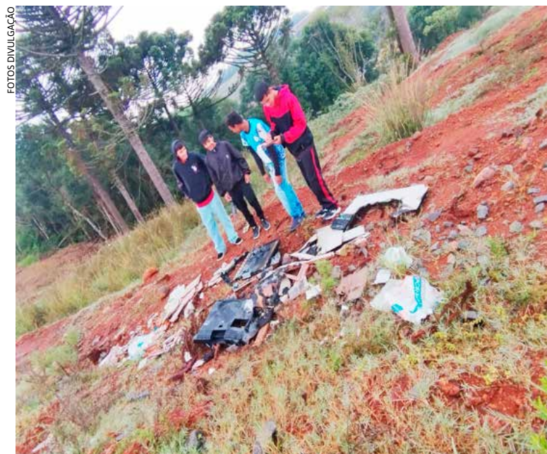
A pesquisa teve início com atividades teóricas nas disciplinas de Geografia e Matemática, abordando temas como urbanização, erosão e sustentabilidade

As reflexões do grupo abordam a necessidade de ampliar ações de