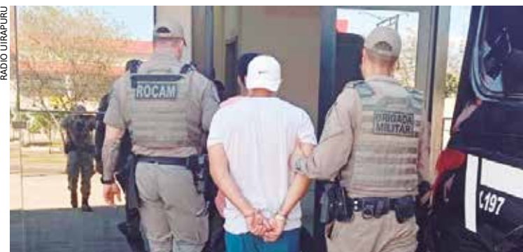
BM recapturou o adolescente cerca de 30 minutos após a fuga

Tentativa de resgate de um adolescente, de 16 anos, que estava sendo transferido do Centro de Atendimento Socioeducativo (Case) de Passo Fundo para a Fundação de Atendimento Socioeducativo (Fase) de Porto Alegre mobilizou a polícia na tarde de quarta-feira (5) e impediu a fuga do menor infrator.