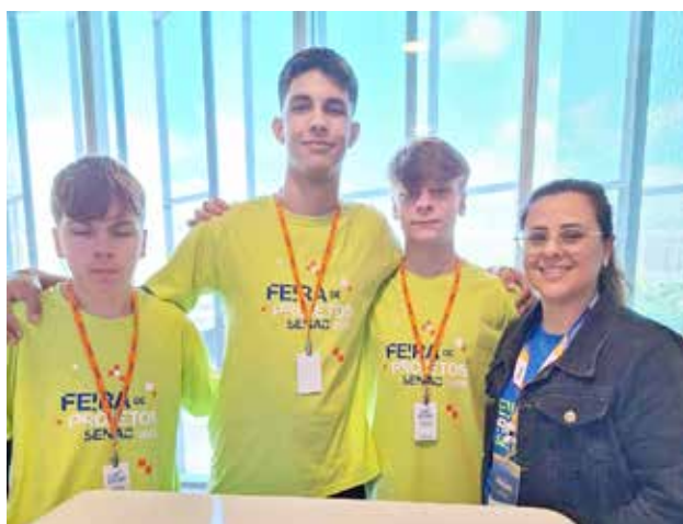
Alunos do Senac Erechim são finalistas da Feira de Projetos Senac RS 2025 e apresentam inovação no 1º Congresso de Educação Sesc e Senac RS

O "Cardápio Digital Inclusivo" reflete o compromisso do Senac Erechim com uma educação profissional transformadora, que