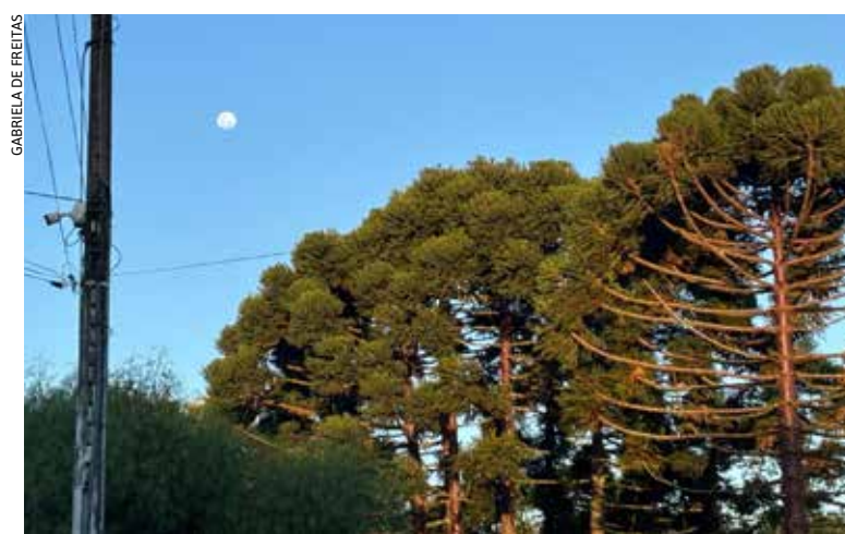
Entre os pontos discutidos estão o fortalecimento da fiscalização urbana, a revitalização de áreas verdes e o descarte adequado de resíduos

educação ambiental e de envolver a comunidade em práticas voltadas à preservação dos recursos naturais. Entre os pontos discutidos estão o fortalecimento da fiscalização urbana, a revitalização de áreas verdes e o descarte adequado de resíduos.