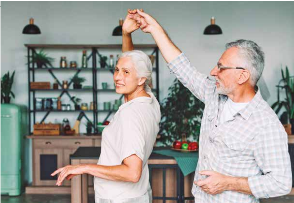
Aceitar as limitações naturais do envelhecimento e buscar ajuda profissional são essenciais para preservar a independência e reduzir o risco de acidentes domésticos

idosos, pois enfraquece os ossos e os torna mais suscetíveis a quebras. Mesmo assim, a condição não impede a recuperação, apenas aumenta o risco de lesões.