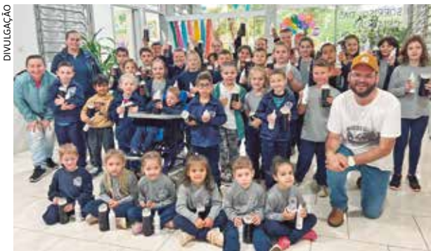
Palestras em todas as escolas do município abordam prevenção e cuidados contra o Aedes aegypti

As escolas de Severiano de Almeida receberam, durante o mês de outubro, palestras educativas voltadas à conscientização sobre o combate ao mosquito Aedes aegypti, transmissor de doenças como dengue, zika e chikungunya.