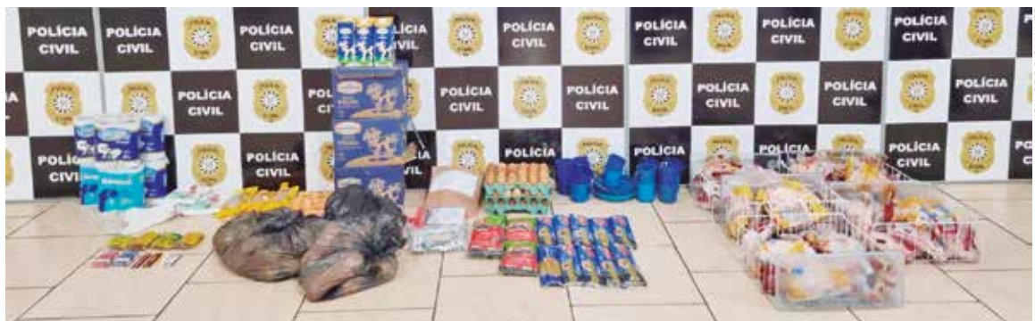
Operação foi desencadeada na manhã de quinta-feira

ALAN DELFIN DIAS | jornalismo@jornalbomdia.com.br