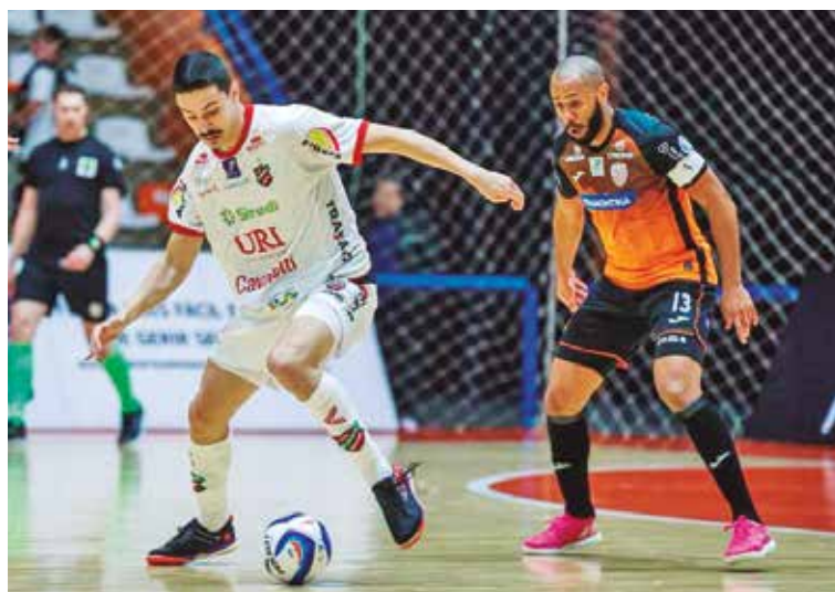
Em Carlos Barbosa, partida encerrou em 3 a 3