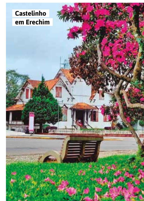
Castelinho em Erechim