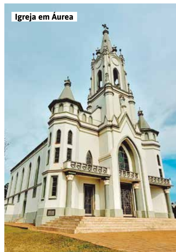
Igreja em Áurea