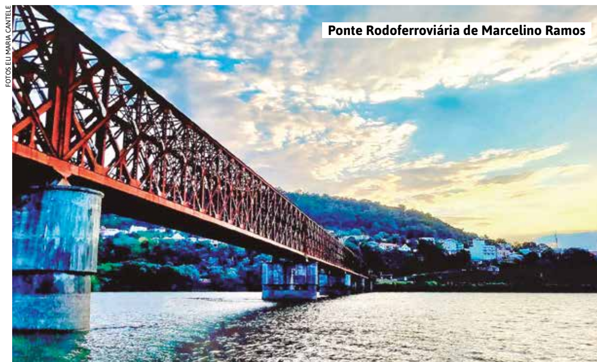
Ponte Rodoferroviária de Marcelino Ramos