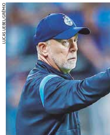
Para Mano, apesar das derrotas, time está conseguindo ser competitivo

didos nas rodadas recentes escaparam por detalhes e afobação. “Precisa de maturidade de equipe. Não dá para se apressar para terminar uma jogada. Se não tem espaço, acalma, roda, para o jogo não virar lá e cá”, avalia o treinador.