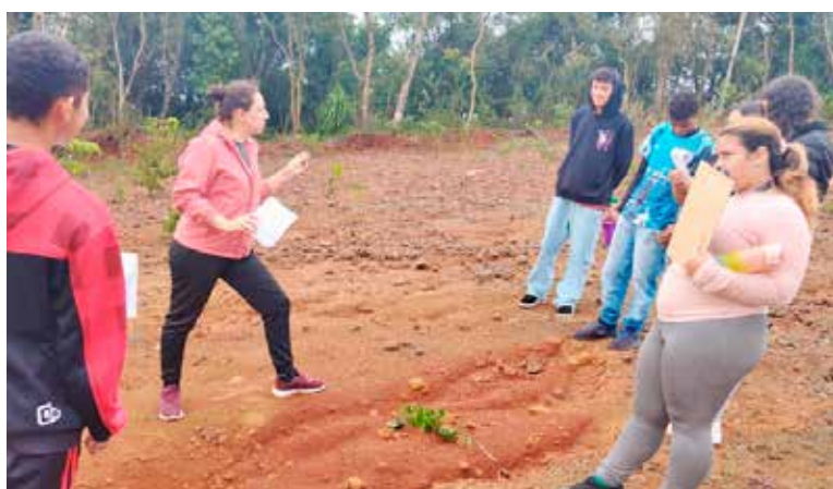
Durante a visita, o grupo utilizou planilhas de observação, anotações e registros fotográficos

Durante a visita, o grupo utilizou planilhas de observação, anotações e registros fotográficos. As análises evidenciaram processos