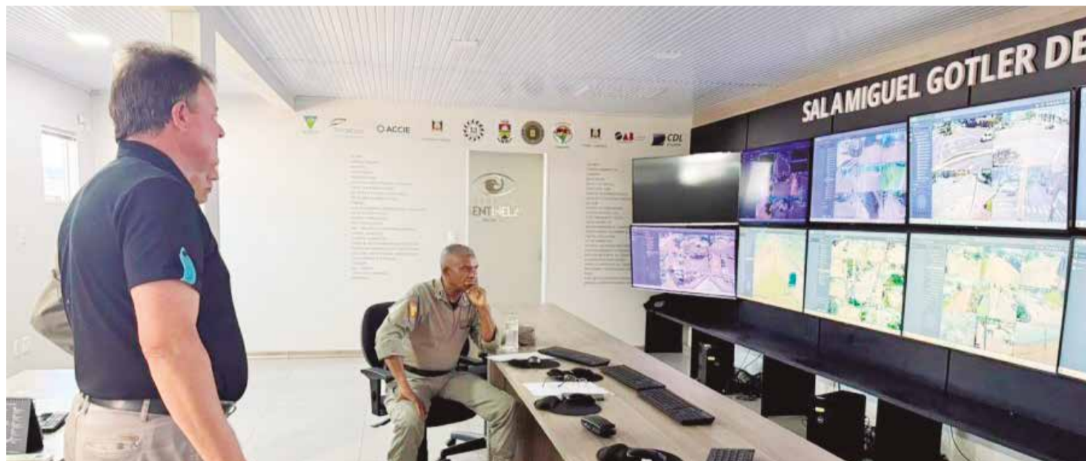
MILENA MEZALURA/COMUNICAÇÃO PME

Município registra os melhores índices desde 2010, com quedas expressivas em homicídios e crimes patrimoniais | 10