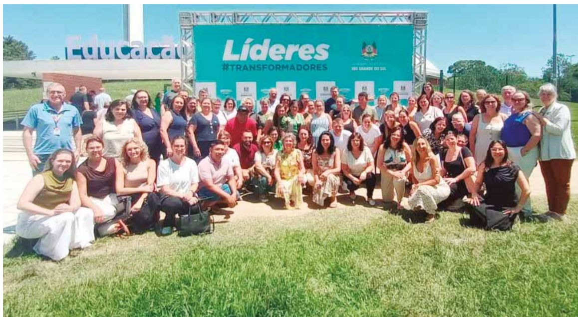
Gestores da 15ª CRE participam de seminário estadual sobre metas e gestão da educação

Com o tema “O Direito à Educação se concretiza na aprendizagem”, o encontro foi estruturado em momentos de acolhimento, painéis temáticos e mesas de debate, abordando desafios relacionados à aprendizagem, à gestão escolar e às estratégias pedagógicas previstas para serem desenvolvidas ao longo de 2026. A recepção aos participantes incluiu apresentação da orquestra do município