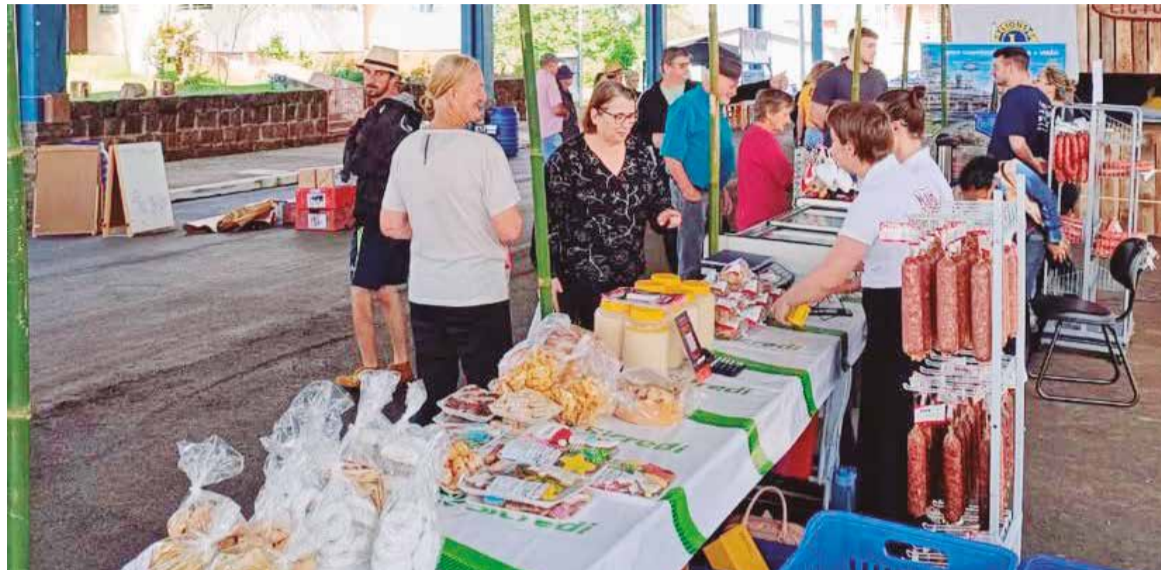
Edição é dedicada à produção local, aos sabores derivados da uva e às manifestações da cultura italiana

Conforme as informações divulgadas pela organização do evento, o festival deverá reunir produtos comercializados diretamente por produtores locais, com destaque para a produção elaborada a partir da uva. Dedicada à produção, aos sabores derivados da uva e às manifestações culturais de origem italiana, a edição vai contar com produtos como suco, geleias ar-