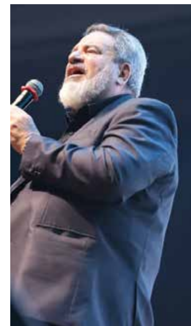
O encerramento do encontro contou com palestra do filósofo e escritor Mario Sergio Cortella

Além do encontro no Auditório Araújo Vianna, os diretores participaram de formações realizadas nos dias 3 e 5 de fevereiro, na Universidade do Vale do Rio dos Sinos (Unisinos), como parte de uma jornada for-