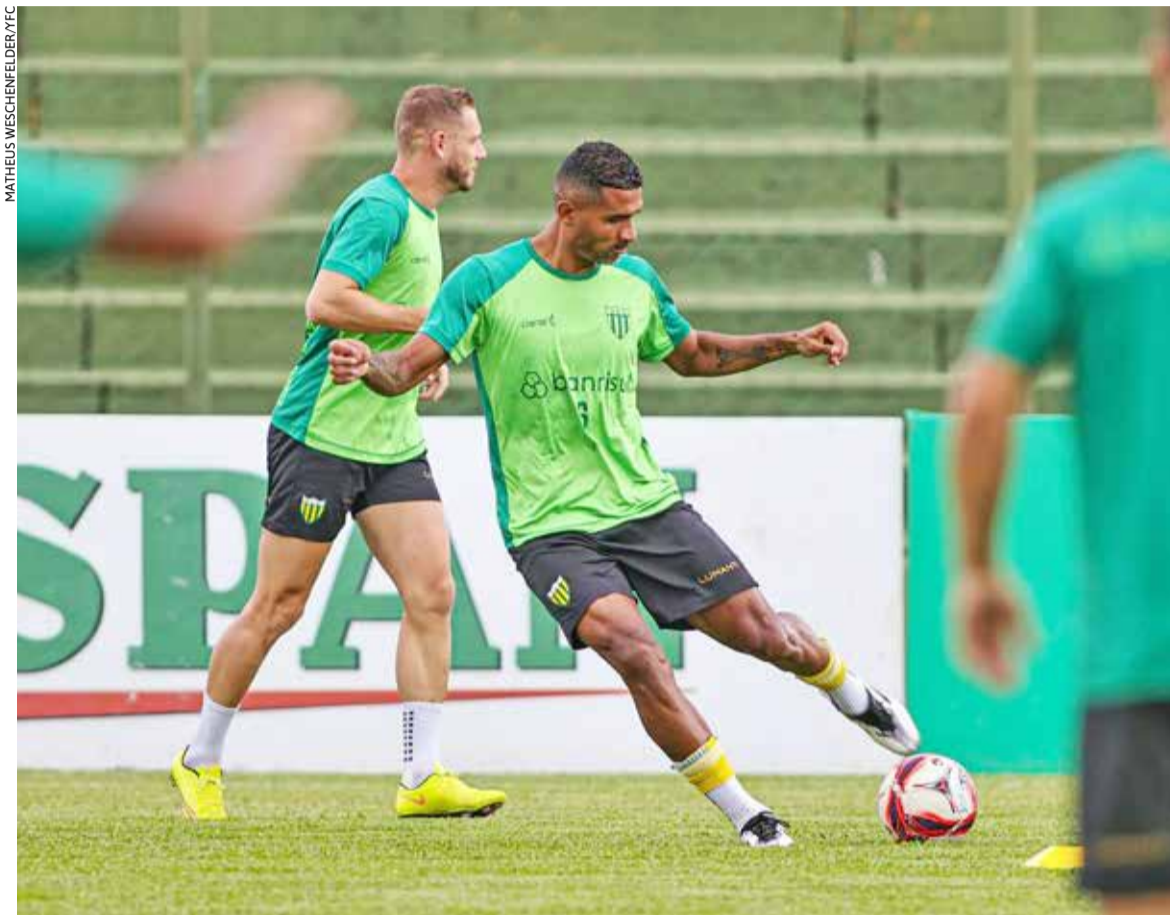
Canarinho encerrou ontem a preparação para a partida

As duas equipes estavam no Grupo B durante a primeira fase e o Caxias terminou na segunda posição, com sete pontos conquistados em cinco jogos. O Ypiranga também somou sete pontos, mas ficou com o terceiro lugar por causa do saldo de gols.