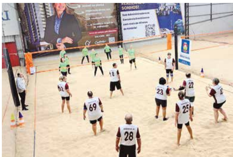
Beach Câmbio vem se destacando pelo seu pelo crescimento no número de praticantes na região

A competição é voltada às categorias Master e Sênior, reunindo atletas da modalidade em um evento que valoriza a prática esportiva, o convívio social e a promoção da saúde. O Beach Câmbio vem se destacando pelo seu caráter inclusivo e pelo crescimento no número de praticantes na região, consolidando-se como uma importante alternativa de atividade física e integração.