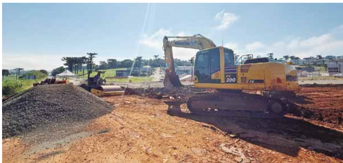
Intervenção de grande porte em frente ao Loteamento Dona Olga amplia sistema de drenagem e prepara a cidade para enfrentar eventos climáticos extremos