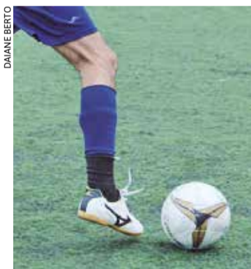
Campeonato será disputado nas categorias Veteranos, Master e Sênior

De acordo com o Departamento de Esportes, a expectativa