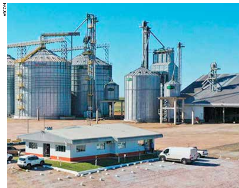
Além da aquisição das duas unidades, a Olfar firmou com a Cotribá um contrato de prestação de serviços pelo prazo de 15 anos, nos seus 31 pontos de recebimento

A parceria fortalece o mercado regional, mantém as unidades em plena operação e amplia a capacidade de recebimento de grãos, oferecendo mais estrutura, agilidade e alternativas de comercialização.